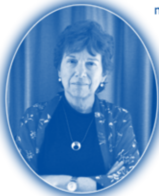
YOLANDA REYES VILLAMIZAR

(Bucaramanga, 1959) Escritora colombiana. Inclineda desde muy temprana edad al cultivo de la creación literaria, estudió ciencias de la educación en la Universidad Javeriana de Bogotá y amplió sus estudios en España, en el Instituto de Cooperación Iberoamericana.