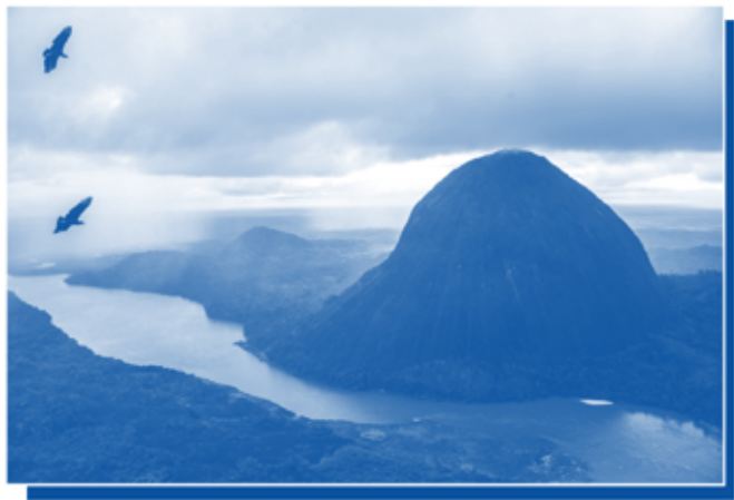
Cerros de Mavecure en Guanía

Colombia ha participado en los últimos 10 años como país invitado, en las Ferias Internacionales del Libro de Quito (2013), Oaxaca-México (2014), Río de Janeiro (2015), Perú (2016), Panamá (2017), Estambul (2018), Madrid (2021), Barcelona (2022), Cuba y Frankfurt (2023).